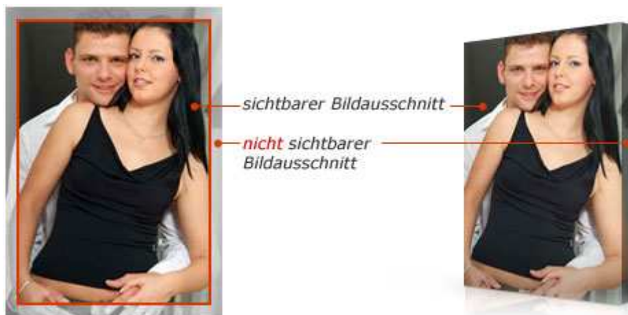
Abb.: Ein Teil des Bildmotivs wird für den umdruckten Rahmen benötigt

Soll auf keinerlei Bildinformationen verzichtet werden, bietet sich die Gestaltung des umlaufenden Rahmens in der Farbe Schwarz oder Weiß an. Die im Consumerbereich gelegentlich angebotene Möglichkeit der Motivspiegelung über den Rand, ist für den Profibereich zumeist ungeeignet. Durch die Spiegelung können sich Bildverfremdungen ergeben, die das Bildmotiv bis ins Lächerliche verzerren. So kann eine über den Rand gespiegelte Hand plötzlich 7 und mehr Finger haben.