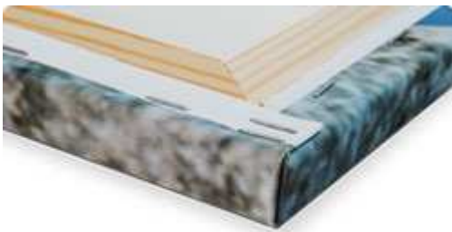
Standardkeilrahmen 2 cm